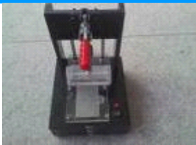
■ 手机 sensor 测试治具