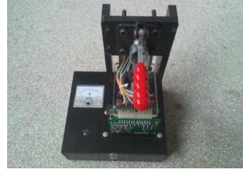
■ 采集主板测试治具