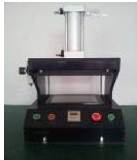
■ 平板电脑外壳压合治具