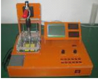
■ 心电图仪测试工装