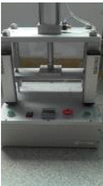
■ 红外线感应气动压合治具