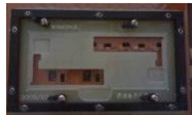
■ 过炉治具 采用进口玻纤，保证使用寿命！