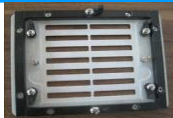
■ LED 灯板过炉治具 采用进口玻纤，保证使用寿命！