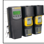
与 MicroDock II 兼容