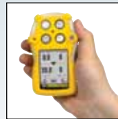
单按钮操作， 使用简单