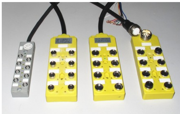
I/O 总线分线盒, M12、M8