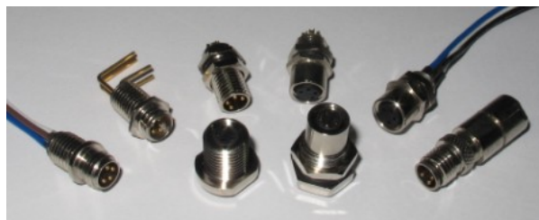
M8 插座带线与不带线