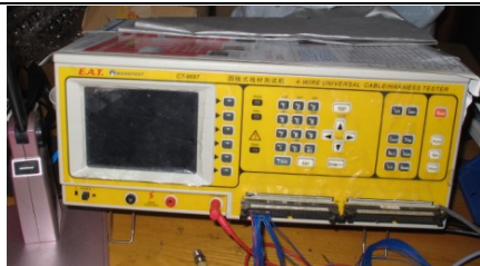
漏电流、接触电阻综合测试仪