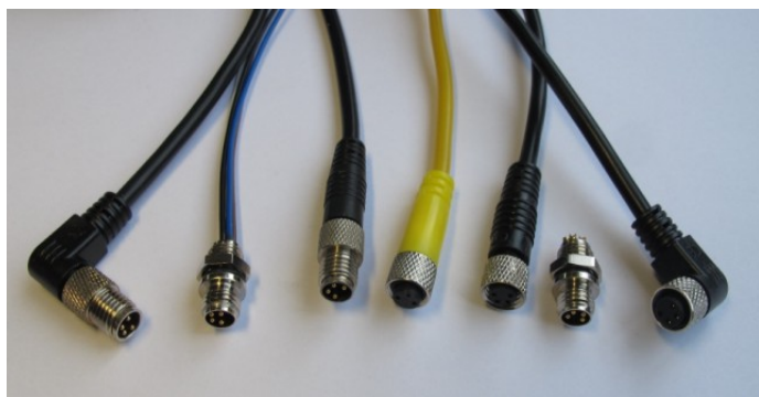
M8 带线与 NC 插头, 直弯、带灯