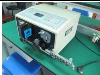
快速电脑下线剥线机