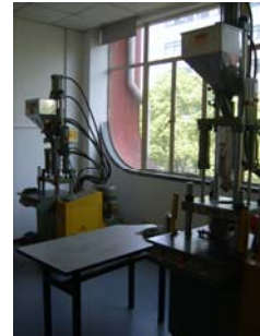
现场机械成型设备