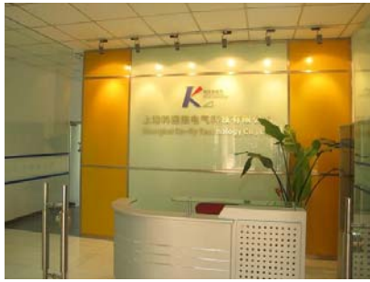
科迎法电气公司前台