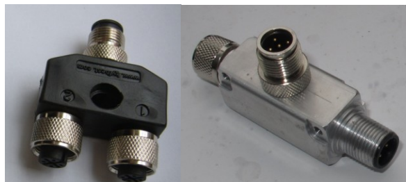
T 与 Y 转接器