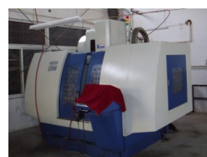
IP 等级测试与水位测试装置