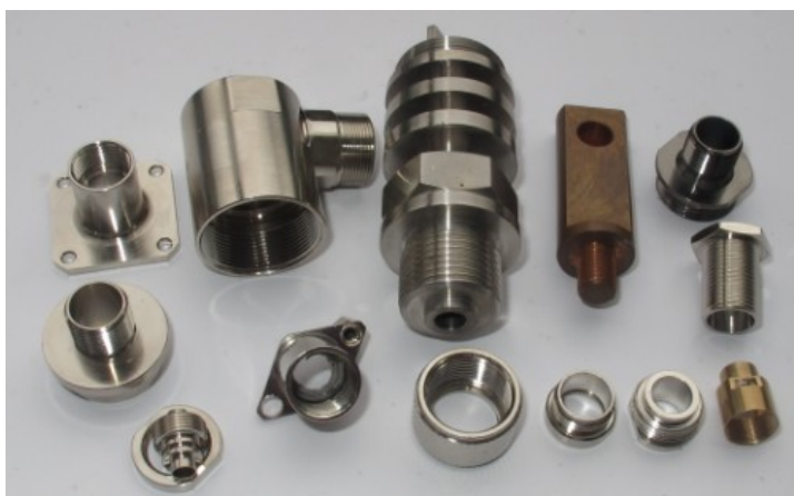
连接器零件精密加工