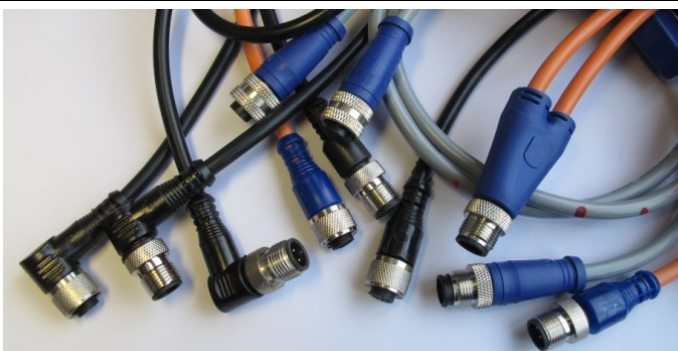
M12 带线与 NC 插头, 直型、弯型