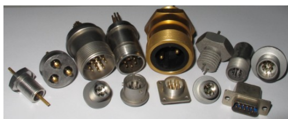
高温高密封连接器与插座