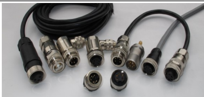
5/8 7/8 连接器与插座