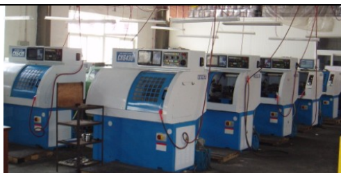
精密机械加工设备