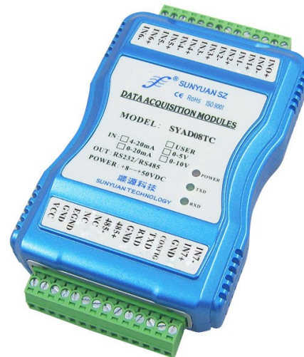
图 2 SYAD08T 模块效果图