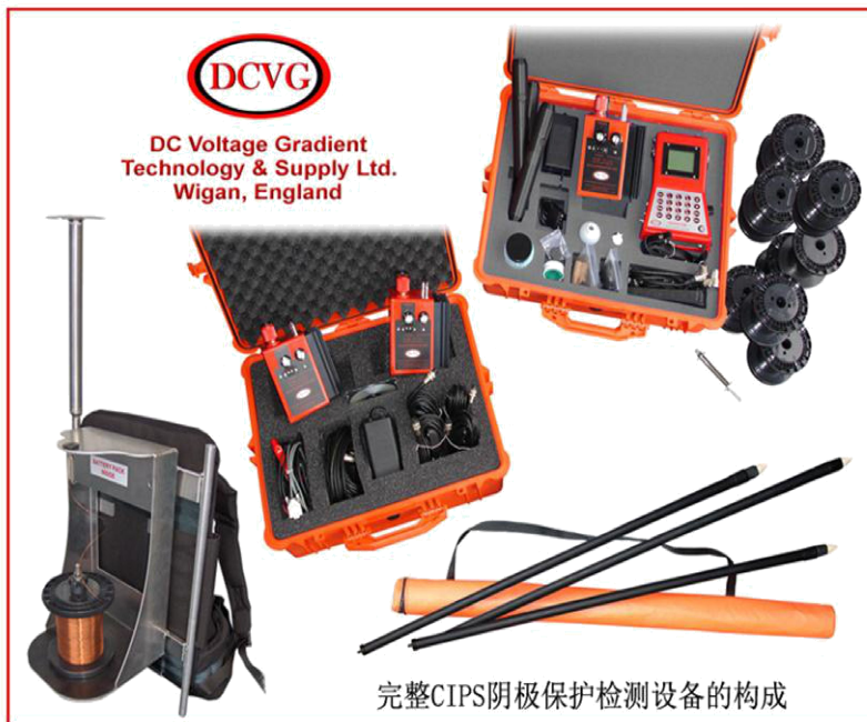
完整CIPS阴极保护检测设备的构成

传统的阴极保护效果测量方法是对管线测试桩进行管-地电位测量，通过管-地电位值来判断管道是否达到-0.85V 的保护电位。它使用一个灵敏的毫伏表和硫酸铜参比电极，通常只能在测试桩处进行电位的接触式测量。该方法的最大问题在于检测工作只能在测试桩附近的 1-2 米距离内有效，管线上绝大部分的管-地电位无法测量出来。因此，管道沿线的某些局部影响因素，比如距离测试桩很近的较大防腐层缺陷可以对测试桩的检测读数产生较大的影响。此外，由于 IR 降的影响，测试桩上得到的管道防护效果方面的信息十分有限。