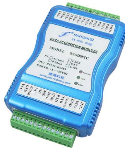
图 2 SYAD08T 模块效果图